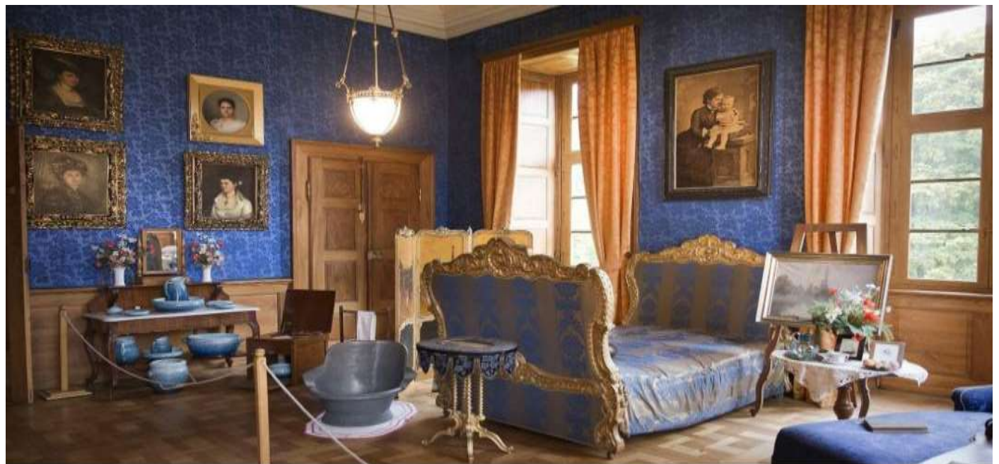
Emma-kamer in het slot. Links hangen de portretten van haar zussen. Die waren in eerste instantie huwelijkskandidaten voor konin