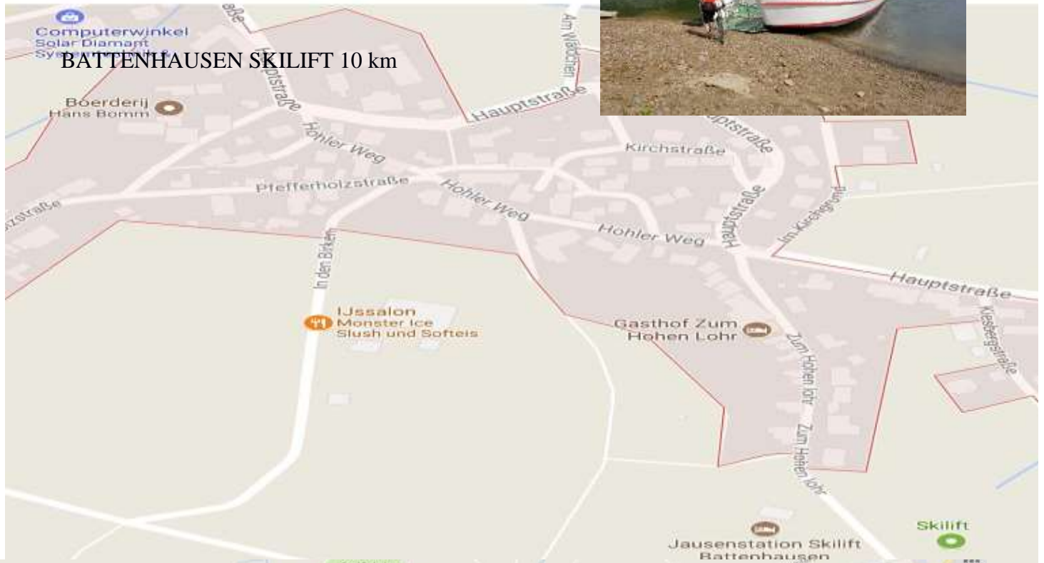
BATTENHAUSEN SKILIFT 10 km